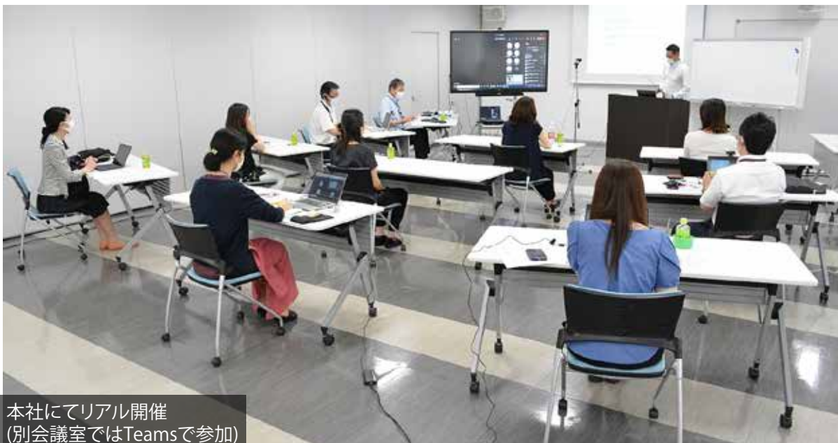
本社にてリアル開催 (別会議室ではTeamsで参加)